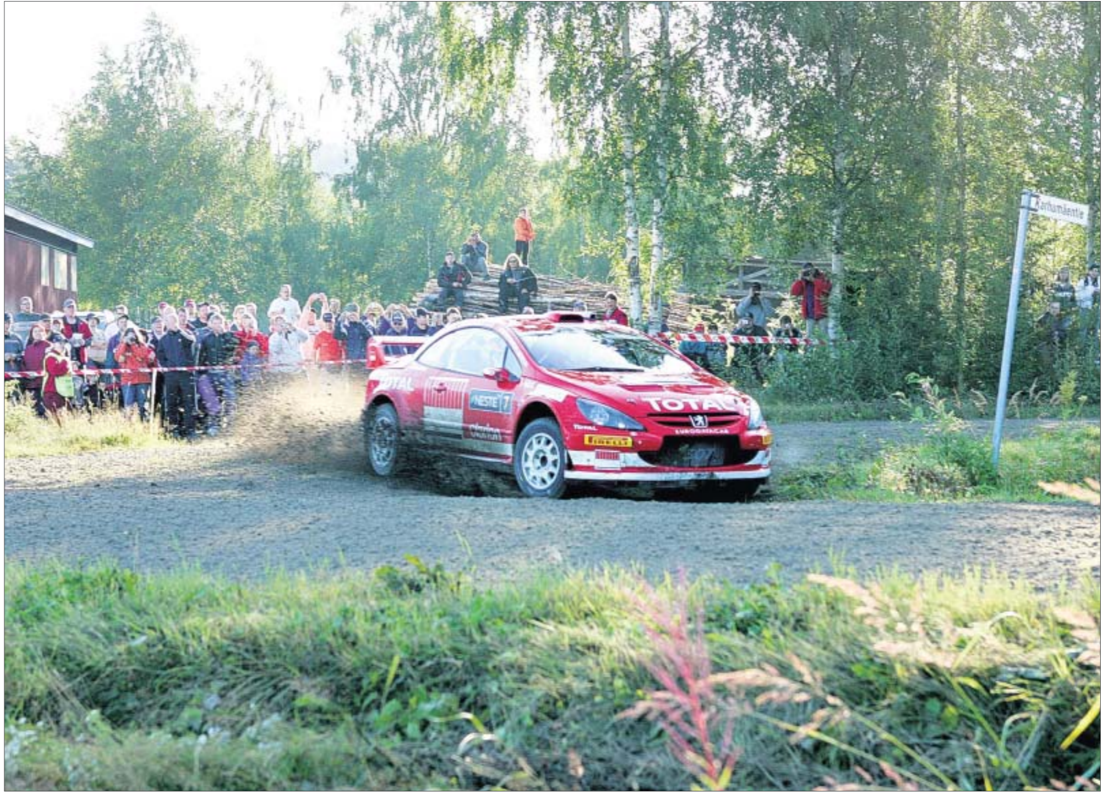
Marcus Grönholm oli Vaherissa sen verran aamu-uninen, että Sebastien Loeb ajoi 3,5 sekunnin pohjat. Sen jälkeen Grönholm meni menojaan.

• Kirjoittaja on Keskisuumalaisen urheilutoimittaja.