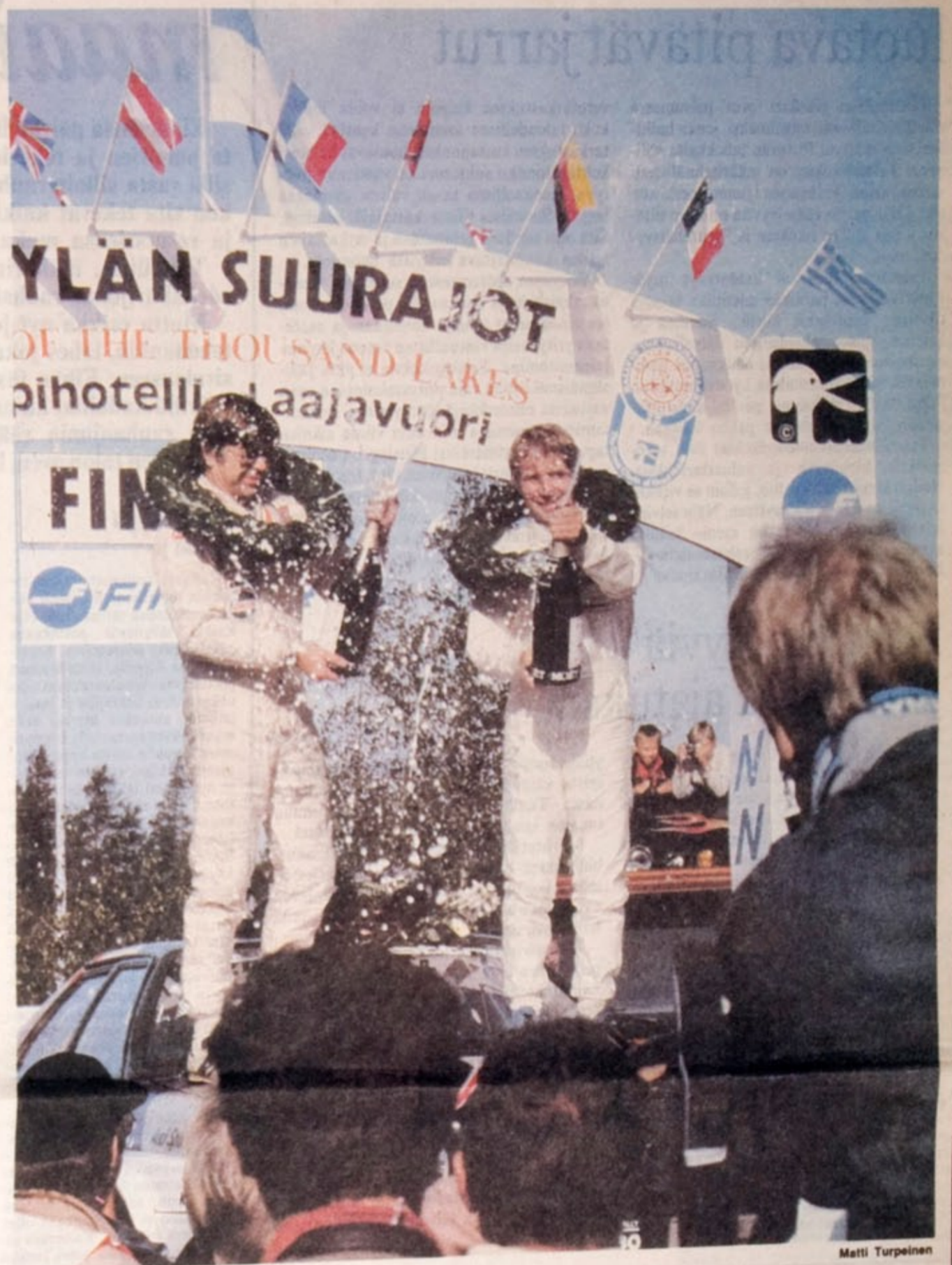
HANNU MIKKOLA (oik.) ja Arne Hertz tavoitteessaan, Laajavuoren yleisön juhliattavana.