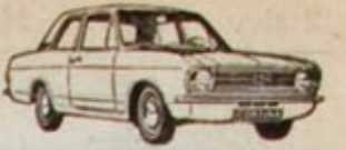
Tilava Cortina 1300 615 hv 11130:- ylli 130 km/l ARE

AREN SUURESTA valaisinvalikoimasta yksi ehdotus: