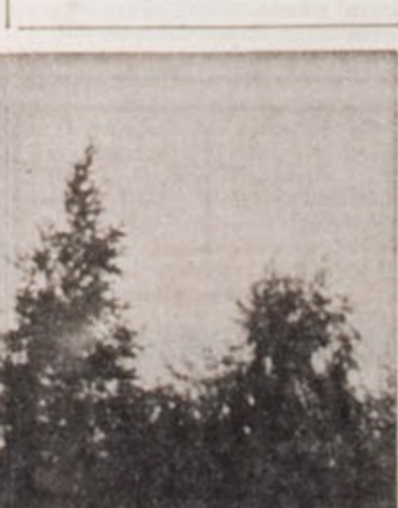
Fouga-Magister laskeutuu Joutsan lentokentälle.

Lagos, 19. 8. (STT-Reuter) Viisitoista neuvostoliittolaista kuljetuskonetta on tuonut sotatarvikkeita, mm. hävittäjiä, Pohjois-Nigeriaan auttaakseen Nigerian liittovaltion varustautumaan kapinallista Biafraa vastaan, kertoivat asiasta perillä olevat lähteet Lagosissa lauantaina.