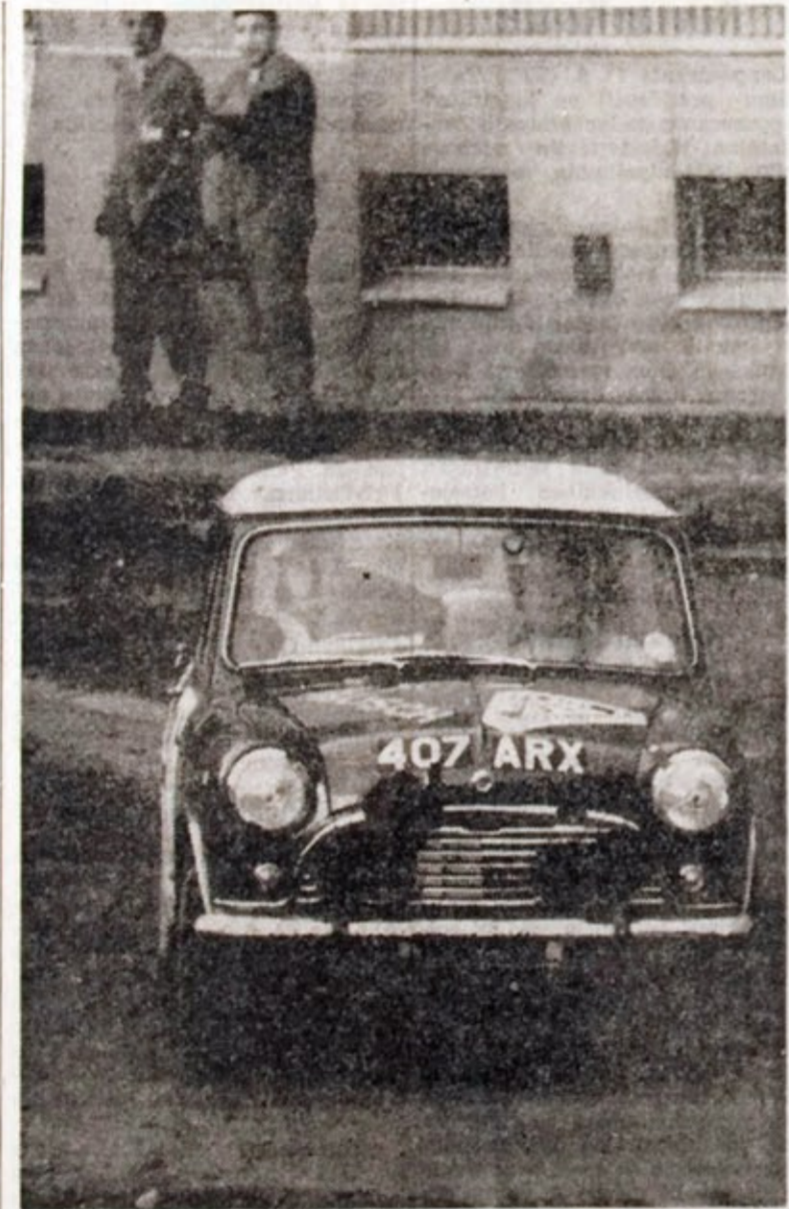
Viime vuoden voittaja Rauno Aaltonen tyylinäyte Oikokadun kulmassa. — Rauno ajoi Harjulla erään parhaista ajoista je sopii vain toivoa, että samanlainen tehti hieman parannettuna jatkuisi.