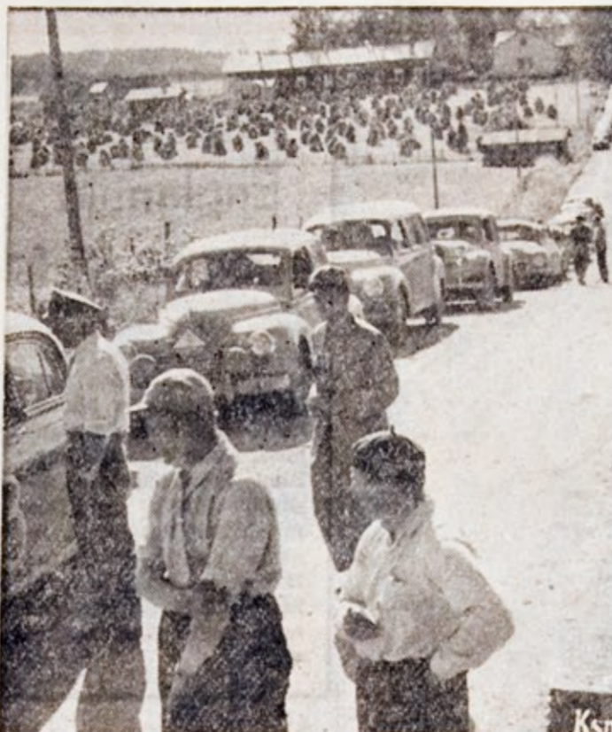
Autojono odottamassa »Petäjän taipaleelle» pääsyä.

Sateisen sään sekä sen ohessa sumun odotettiin tuovan yllätyk- siä kilpailijoille, mutta toisin kä- vi. Suurajot saatiin tänä vuonna suorittaa mitä parhaimman sään vallitessa. Kilpailijat osoittivat ajossa erinomaisia kuntoja ja kil- pailijat hallitsivat hyvin ajok- kinsa. Koko ajon aikana ei ta- pahtunut ainostakaan liikenne- onnettomuutta. 2400 km:n mittai- nen rallyreitti ajettiin melkein sataprosenttisesti virhepisteittä, samaan selviettiin hyvin 69 km:n mittaiselta »Jätjän pikataipa- leelta» Kittilä — Sodankylä. Jy- väskylän lähistöllä sijainnut 22 km:n mittainen »Petäjän» pika- taival oli kuitenkin paha kon- pastuskivi, josta ainoastaan viisi kilpailijaa selvisi virhepisteittä. Koska eroja ei ennen viimeistä pikataivalta alkanut syntyä jou- duttiin »Petäjän» taipaleella ko- rottaa keskituntinopeuksia. Kätköpäin järjestys ratkesi lo- puillisesti vasta kiihtyvyyssä ja jarrutuskokeissa, joka suoriteti- in Jyväskylässä välittömästi maaliintulon jälkeen.