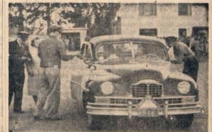
Kilpallussa toiseksi sijotunut Korppoo autoineen maalissa.